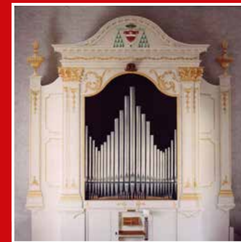
Organo di Gaetano Callido dell'anno 1792, restaurato dalla ditta Zanin di Codroipo